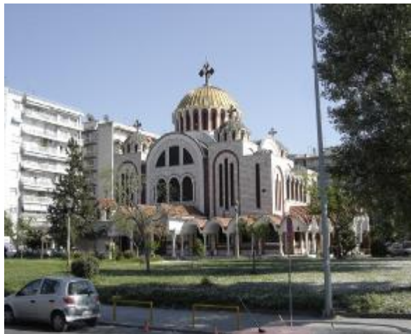
Cerkiew w Salonikach (Sołun) pod wezwaniem Św. św. Cyryla i Metodego, w rodzinnym mieście Apostołów Słowiańszczyzny

Święci nasi Orędownicy, Cyrylu i Metody, módlcie się za Nami !